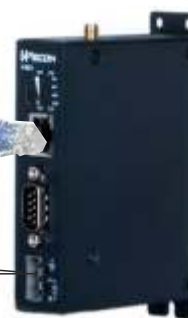
V-BOX 2G / V-BOX-4G.