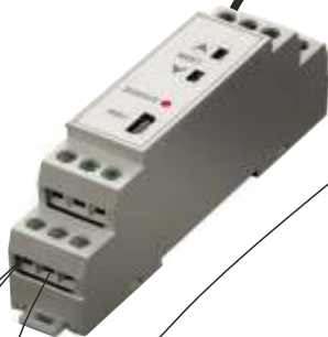
Convertor de célula de carga salida 0-10 Vdc