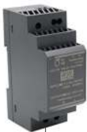
Fuente de alimentación 24 Vdc 2,5 A.

Visualización de los valores de células de carga a distancia.